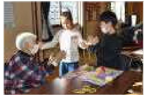
【地域の方からあやとりを教わったよ！】

12月6日（水）、2年生の子どもたちが餌釣会館で、地域の方から昔の遊びを教えてくださいました。昔の遊びは、お手玉やけん玉、メンコなど。最初は難しかった昔の遊びもコツを教えてくださいましたので、だんだんと上手になっていきました。最後には、歌のプレゼントをして大きな拍手をもらいました。地域の方々との交流も兼ねたこの行事。これからもこのようなつながりを大事にしていきたいと感じた時間でした。子どもたちにも地域の方々にも笑顔の輪が広がりました。