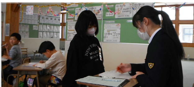
【教師ミニミニ体験で2人の高校生が来校。主に1年生と4年生で指導補助などをしてもらいました。】

*1/29(月)のとびつきり発表会では、3年生から6年生が総合的な学習の時間で学習したことを発表します。どなたでも参加できます。ご来場をお待ちしております！