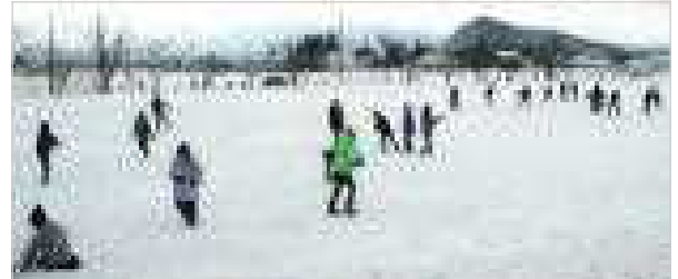
【休み時間、元気に外で遊ぶ子どもたち (12/19)】

8月25日から始まった2学期も今日で終了です。長い期間の2学期でしたが、子どもたちは、日々の授業を大切にしながら、学習発表会をはじめとする様々な学校行事にも、真剣に取り組んできました。どの学年の子どもたちにも一生懸命にがんばる姿が見られ、とてもうれしく思います。このがんばりを3学期につなげ、さらに成長できることを願っております。