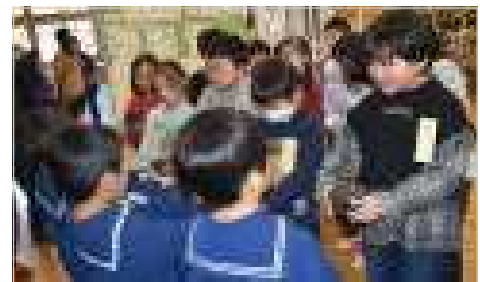
【どうもありがとう 大事に育てるよ！】

また、いただいたアジサイの挿し木は、1年生がバス停付近に植えました。開花までには時間がかかりそうですが、地域の方々が元気づけられるような立派なアジサイに成長してほしいと思います。