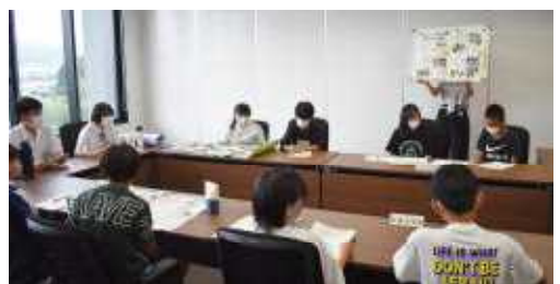
【グループ別協議で本校の取組を紹介】

7月27日(木)、大館市子どもサミット代表会議が市本庁舎議場で行われました。参加者は大館市内の各小中学校から代表者2名ずつ、50名が参加して行われました。上小からは、6年生の2人がサミット代表委員として参加しました。議場や小中学生合同のグループなどで、本校の活動の様子やこれからの取組について、積極的に意見交換する姿は大変立派でした。2学期以降、話し合いで決まったことを各校へ持ち帰り、「大館のために自分たちにできる取組」を進めていきます。