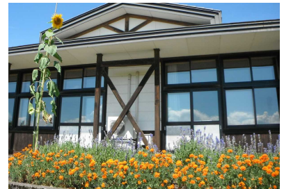
【花壇の「ひまわり」は2m以上】

2学期も上小っ子は頑張ります！今学期もPTAや地域の皆様のご支援をよろしくお願ひします。